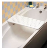
Planche de bain