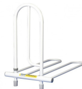
Barre de lit