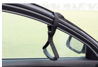
Sangle sortie véhicule