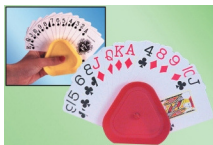
Support de cartes