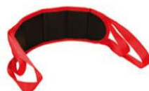
Ceinture de relevage et de transfert