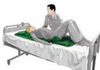
Drap de glisse