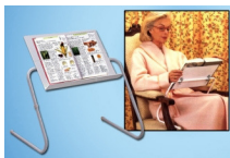
Support de livre