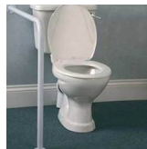
Barre d'appui toilettes