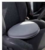
Disque de rotation voiture